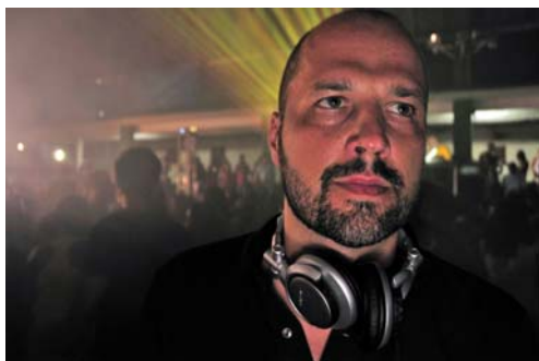
Foto: Danie Haaksman, Berlin, unterstützt in unserer elften Förderrunde

Rund 462.000 Euro bewilligte unser Aufsichtsrat in seiner dritten Fördersitzung dieses Jahres, der elften seit Gründung. Erneut werden damit die Mittel für künstlerisch wie auch wirtschaftlich gleichermaßen überzeugende Projekte bereitgestellt. Deren Gesamtvolumen liegt diesmal bei mehr als 1,2 Mio. Euro.