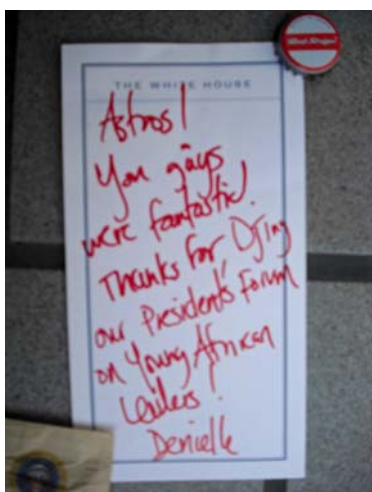
Foto: Danksagung inklusive aktuellem Zuckertütchen aus dem Weißen Haus (unten links) – „Astros! Ihr ward fantastisch. Danke fürs DJing auf dem 'Forum On Young African Leaders' des Präsidenten, Danielle“

groß wurde und einem Videodreh kam es am 4. August in der Homebase der Ancient Astronauts in Washington zu einer überraschend kurzfristigen Anfrage: Würdet ihr im Weißen Haus auflegen?